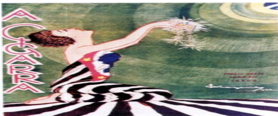
As jóias bélicas. A capa da revista Cigarra mostra uma jovem vestida com a bandeira de São Paulo oferecendo suas jóias para serem transformadas em recursos para os paulistas que lutavam na Revolução de 1932.