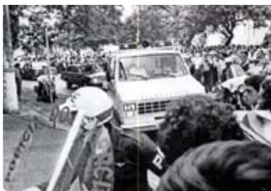
Em frente ao Instituto do Coração, em São Paulo, o povo esperava pela chegada de Tancredo

Uma multidão montou guarda à frente dos portões do hospital para velar, chorar e orar pela saúde dele. Em uma onda de ecumenismo sem precedentes na história da política brasileira, católicos, evangélicos, espíritas, judeus, muçulmanos, umbandistas, videntes, pais-de-santo e esotéricos de todos os matizes fizeram suas preces e, juntos, pediam pelo seu restabelecimento.