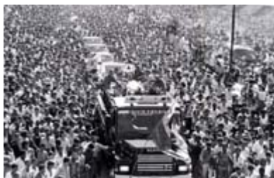
O povo na rua acompanha o caixão de Tancredo

aproximando as figuras históricas de Tancredo e Tiradentes, dois mártires que Minas deu à história nacional. Dois anos depois do ocorrido, tal versão seria sustentada em uma reportagem da Veja, amparada por uma declaração de um dos médicos que teria acompanhado o estado clínico de Tancredo até o fim. Indagado a respeito, 20 anos depois, José Sarney balança a cabeça, negativamente: "Esta é uma daquelas histórias que nunca ninguém jamais conseguirá confirmar".