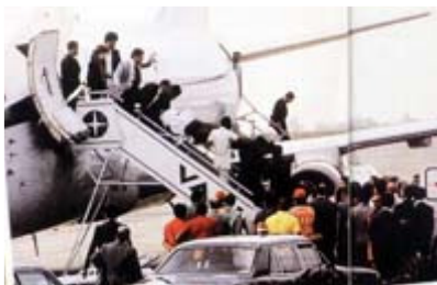
Transferência para São Paulo foi cercada de polêmica

Enquanto a trupe de branco batia cabeça, Tancredo retornou à sala de operação, em 20 de março.