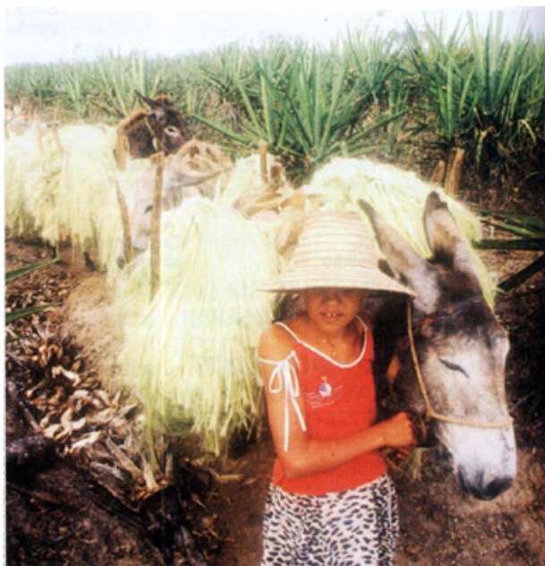
Um dos mais sérios problemas no quadro social e econômico da agricultura brasileira é a baixa qualidade da mão-de-obra empregada, que se reflete em uma baixa produtividade e mantém precárias as condições de vida do homem do campo.

Duas características marcantes dessa mão-de-obra são o elevado grau de subnutrição e o analfabetismo (atinge aproximadamente 40% da população rural). Ambas interferem na produtividade, pois o trabalho no campo requer força física e saúde, além de informação ao menos em níveis elementares.