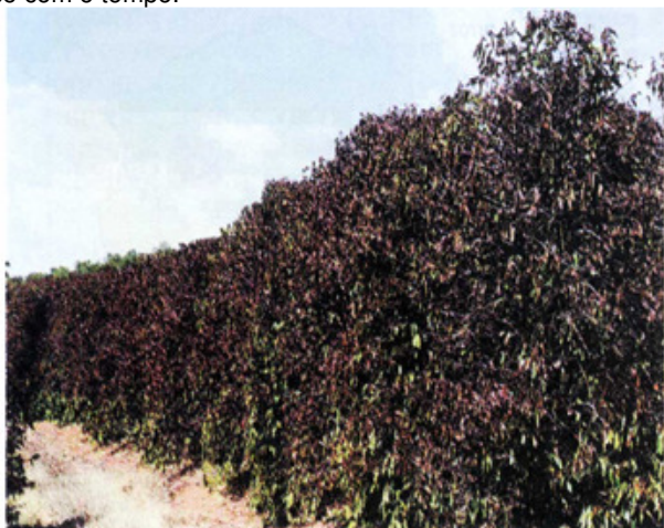
As conseqüências desastrosas dos chamados "azares climáticos" na agricultura podem ser reduzidas com a aplicação de tecnologia — por exemplo, irrigação artificial contra a seca ou recursos da biogenética para os vegetais suportarem a geada. Na foto, cafézal afetado pela geada.

Plantar custa caro e envolve riscos de toda ordem; se não há diretrizes capazes de assegurar ao produtor uma rentabilidade que compense o trabalho e o investimento aplicados na terra, para ele é preferível deixá-la ociosa, valorizando-se com o tempo.