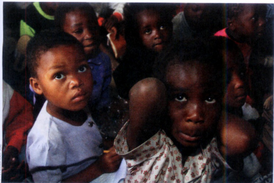
Órfãos causados pela aids no Malauí, que tem meio milhão de crianças sem pais em razão da doença, 20% delas infectadas

sul, que ficará com 50% da renda petrolífera. Como eventuais sanções econômicas internacionais podem atrapalhar as ótimas perspectivas da indústria do petróleo, tudo indica que o governo sudanês fará um esforço extra para pacificar a região de Darfur.