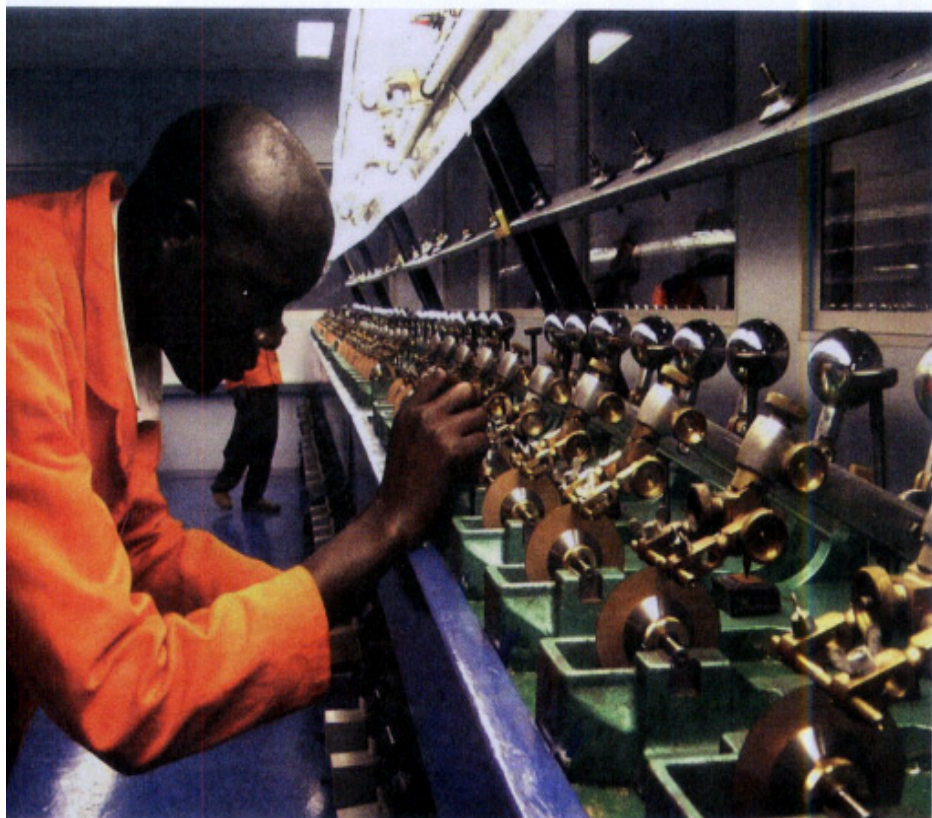
Linha de produção da maior empresa de lapidação de diamantes do mundo, na Namíbia

África continua devastada por grande número de conflitos. No oeste, centro e sul do continente, eles são motivados pela disputa em torno de territórios ricos em minérios. No Golfo da Guiné e na região do Saara, as disputas ocorrem em regiões com reservas de petróleo.