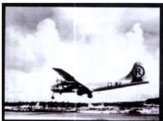
Seis de agosto de 1945. Superbomba explode sobre a cidade de Hiroshima

Truman recebeu uma notícia que havia muito aguardava. Num ultra-secreto experimento no deserto do Novo México, militares e cientistas do projeto Manhattan realizaram com sucesso a primeira explosão nuclear. Truman não se conteve e durante o encontro com Churchill e Stálin, cochichou no ouvido do ditador soviético: "Temos um explosivo muito poderoso que iremos usar contra os japoneses e pôr fim à guerra".