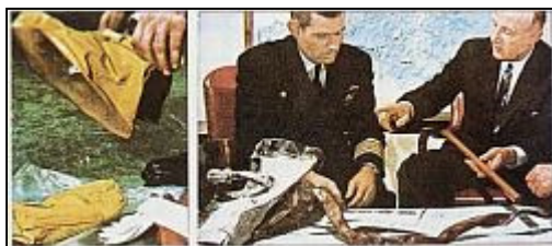
Com a ajuda de uma garra mecânica, alguns restos puderam ser recuperados A vista dos objetos que se puderam recuperar, o Tribunal de Pesquisa da Marinha não encontrou explicação para o ocorrido. O mistério permanece.