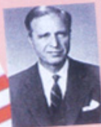
Prescott Bush, avô do atual chefe da Casa Branca, fez fortuna com a venda de armas: conexão nazista

3 OS ATENTADOS DE 11 DE SETEMBRO A deputada americana Cynthia McKinney, do Partido Democrata, acusou o presidente George W. Bush de ter interesses no atentado terrorista de 2001. Bush precisava de uma guerra, já que seu pai era diretor da principal fornecedora de material bélico para os Estados Unidos, a Carlyle Group.