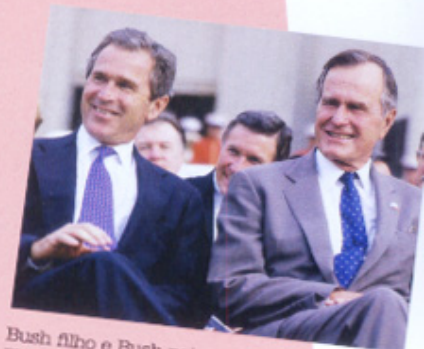
Bush filho e Bush pai: membros de sociedade secreta extraterrestre

5 POUPANDO OS AMIGOS Exatamente no dia 11 de setembro, Bush teria aconselhado cidadãos israelenses a não irem trabalhar no World Trade Center. Autoridades do governo também teriam sido avisadas para não tomarem aviões que sobrevoassem o espaço aéreo de Nova York e Washington, alvos dos ataques.