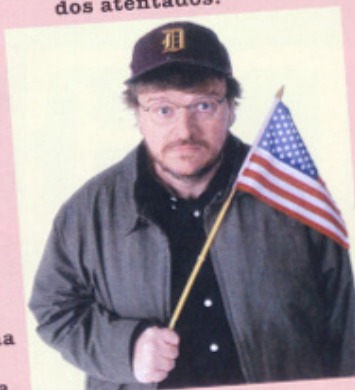
O cineasta Michael Moore denuncia os negócios da família Bush: Bin Laden era sócio

4 NO MESMO TIME DE BIN LADEN A mesma deputada Cynthia McKinney disse que a polícia americana foi instruída a não investigar grupos terroristas sauditas, porque eles mantêm relações comerciais com empresas ligadas aos Bush. No filme Fahrenheit 11 de Setembro , o cineasta Michael Moore mostra as ligações comerciais entre os Bin Laden e os Bush, incluindo uma reunião que Bush filho teve com a família meses antes dos atentados.